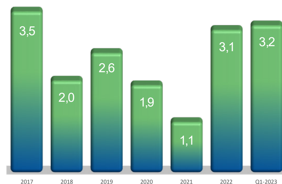
Utvikling H1-verdi rullerende 12 måneder

Sykefraværet for virksomhetene i Infra Group i første kvartal 2023 var 4,1 %. Det er positivt å observere at virksomhetene opplever en nedadgående trend i sykefravær siste 12 månedene. De ekstra ressursene virksomhetene bruker i arbeidet med å få langtidssykemeldte tilbake i arbeid ser ut til å gi effekt.