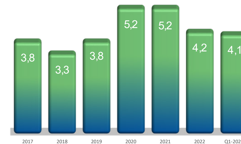
Utvikling sykefravær (%)

I Infra Group er hver enkelt medarbeider viktig for å drive konsernet fremover. Fokus har derfor alltid vært på å finne de beste medarbeiderne uavhengig av kjønn, etnisitet, nasjonal opprinnelse, hudfarge, språk, religion og livssyn. Konsernet har en rekrutterings- og personalpolicy som skal sikre like muligheter og rettigheter og hindre diskriminering.