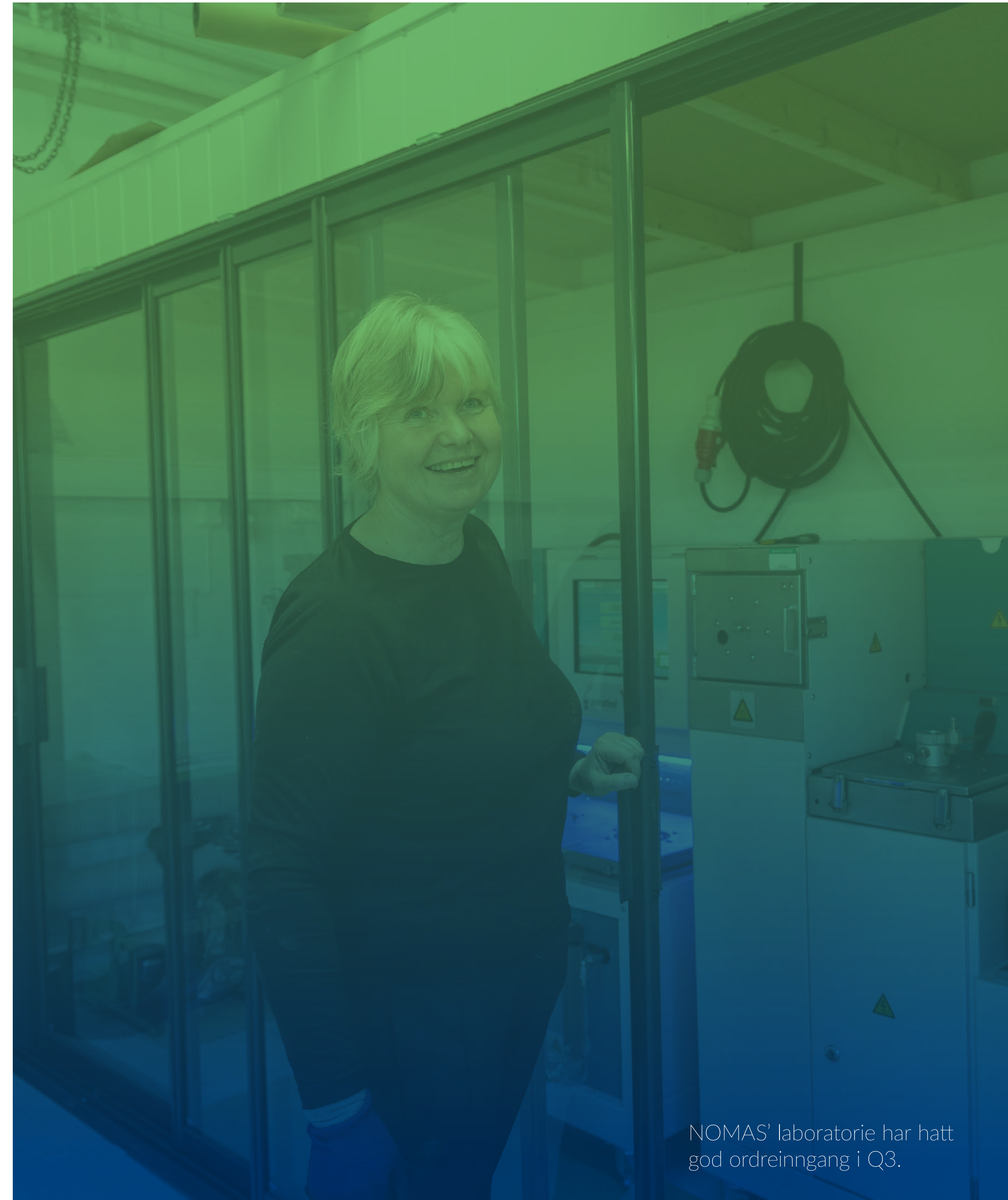
NOMAS' laboratorie har hatt god ordreinngang i Q3.

I eksisterende prosjektportefølje er vårt hovedfokus på effektiv planlegging og produksjon, løpende avklaringer av tilleggskrav og systematisk håndtering av risiko og muligheter for å optimalisere resultatet for både byggherrene og konsernet.