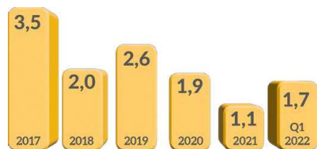
Utvikling H1-verdi rullerende 12 måneder

Sikkerhetskulturprogrammet fortsetter som planlagt i 2022 med flere livreddende regler, nye opplæringsprogrammer og måling av effekter. Målet er at alle skal komme TRYGT HJEM - hver dag! Vi mener at en langsiktig involvering av alle ansatte i arbeidet for en kultur hvor sikkerhet står i fokus er riktig vei til målet.