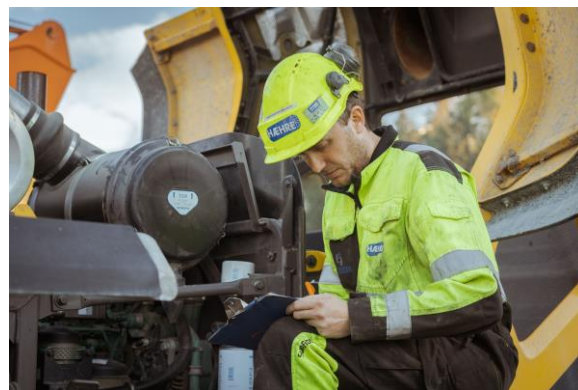
Pågående servicearbeid utført av Hæhre & Isachsen Verksted.

Virksomhetene i Betonmast-konsernet og i Steen & Lund ble avhendet i fjerde kvartal 2019. Disse virksomhetenes resultater i tredje kvartal 2019 og helår 2019 er vist som resultat etter skatt for ikke videreført virksomhet. Se også note 9 Ikke videreført virksomhet .