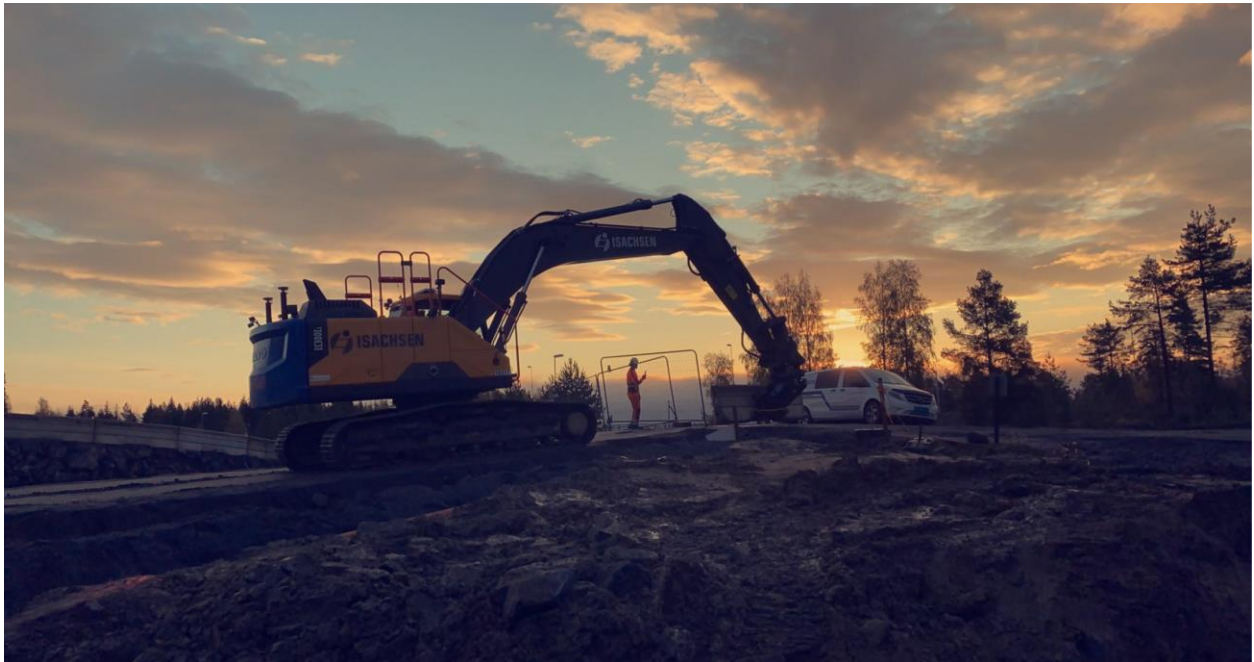
Soloppgang på Fiskumparken, mellom Hokksund og Kongsberg.