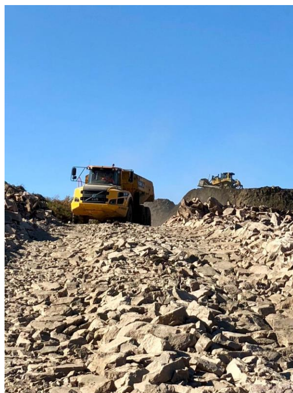
Isachsen Anlegg i full gang på Røyken Næringspark.

Usikkerhet rundt fremtidig utvikling og den økte smittespredningen vi ser ved inngangen til fjerde kvartal gjør det enda viktigere å prioritere riktige prosjekter og følge dem tett opp i gjennomføringsfasen. Målet er at posisjonen som rendyrket anleggsaktør skal resultere i en betydelig bedring av lønnsomhet, frigjøring av bundet kapital og mer balansert risiko i anleggsprosjektporteføljen. Styret og administrasjonen arbeider med konsernets kostnadsbase for å sikre en mest mulig konkurransedyktig virksomhet fremover.