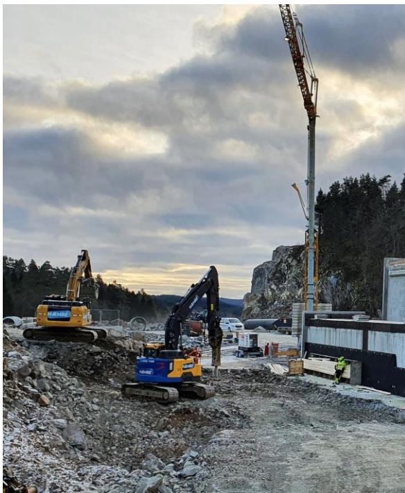
Pågående arbeid på E39 Mandal øst - Mandal by

Konsernets virksomheter har hatt betydelig fokus på å redusere kapitalbinding og frigjøre likviditet. Den positive kontantstrømmen akkumulert i 2020 er etter styrets vurdering en konsekvens av det nedlagte arbeidet.