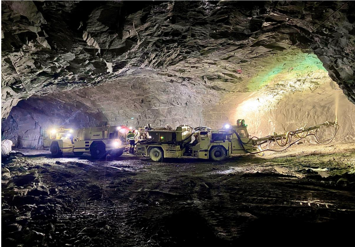
Smisto: Smibelgsiden mot Manåga etter utstrossing