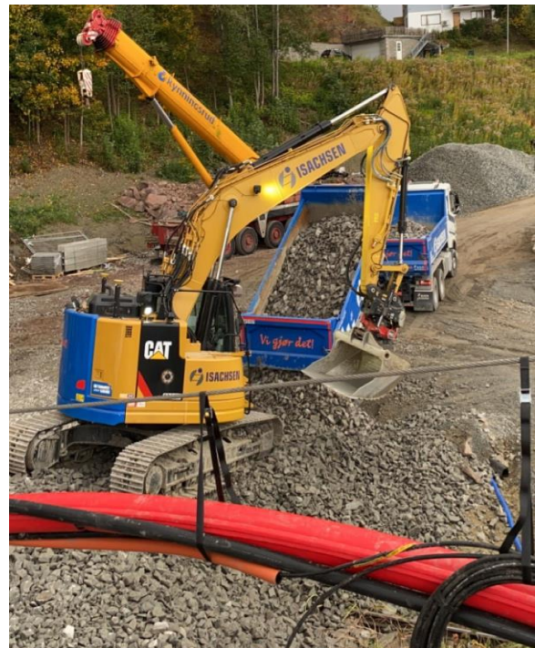
Etablering av kulvert på Ringerike

Usikkerhet rundt fremtidige restriksjoner og uforutsigbarheten knyttet til smittespredning gjør det enda viktigere å prioritere riktige prosjekter og følge dem tett opp i gjennomføringsfasen. Målet er at posisjonen som rendyrket anleggsaktør skal resultere i en betydelig bedring av lønnsomhet, frigjøring av bundet kapital og mer balansert risiko i anleggsprosjektporteføljen. Styret og administrasjonen arbeider med konsernets kostnadsbase for å sikre en mest mulig konkurransedyktig virksomhet fremover.