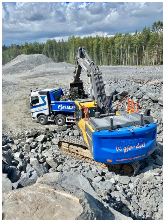
Isachsen Anlegg i gang med uttak av masser.

Usikkerhet rundt fremtidig utvikling gjør det enda viktigere å prioritere riktige prosjekter og følge dem tett opp i gjennomføringsfasen. Målet er at posisjonen som rendyrket anleggsaktør skal resultere i en betydelig bedring av lønnsomhet, frigjøring av bundet kapital og mer balansert risiko i anleggsprosjektporteføljen. Styret og administrasjonen arbeider med konsernets kostnadsbase for å sikre en mest mulig konkurransedyktig virksomhet fremover.