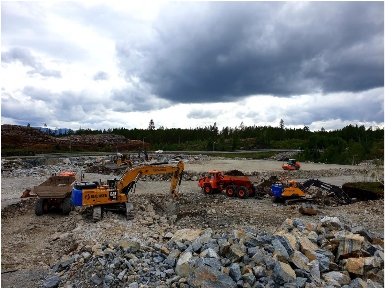
Pågående arbeider Toppen Næringspark, Kongsberg.