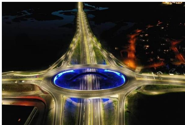
Åkerkrysset på Hamar, en del av den nyåpnede veistrekningen E6 Kolomoen-Arnkvern.

Virksomhetene i Betonmast-konsernet og i Steen & Lund ble avhendet i fjerde kvartal 2019. Disse virksomhetenes resultater i første kvartal 2019 og helår 2019 er vist som resultat etter skatt for ikke videreført virksomhet. Se også note 9 Ikke videreført virksomhet .